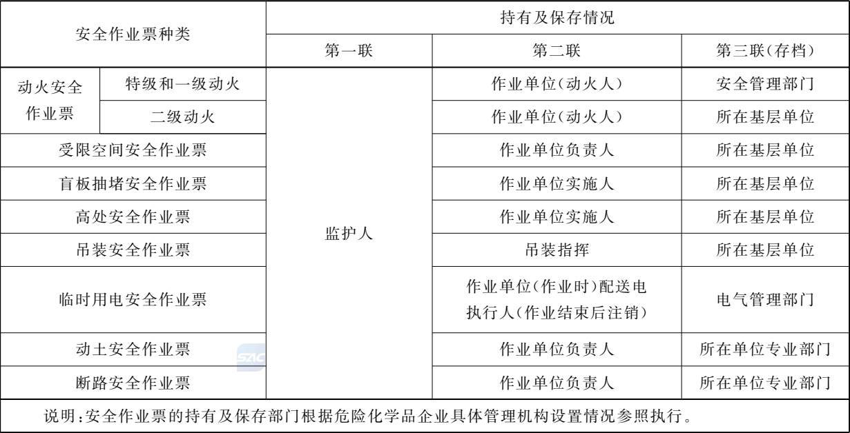
表 B.2 安全作业票的持有及保存的内容

安全作业票一式三联,其持有和存档部门(人)参见表 B.2。安全作业票应至少保存一年,作业过程影像记录应至少留存一个月。